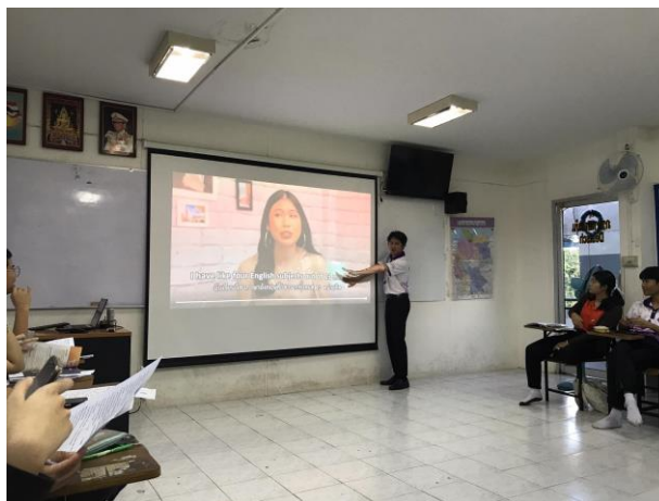
ภาพที่ 1 การฝึกทักษะการฟังโดยใช้รายการโทรทัศน์

จากตารางที่ 1 พบว่า ผลการทดสอบวัดความสามารถด้านการฟังภาษาอังกฤษโดยใช้รายการโทรทัศน์ของนักเรียนชั้นมัธยมศึกษาปีที่ 5/15 จำนวน 39 คน ซึ่งเป็นนักเรียนกลุ่มตัวอย่าง มีนักเรียนที่ผ่านเกณฑ์จากการทำแบบทดสอบวัดความสามารถด้านการฟังภาษาอังกฤษโดยใช้รายการโทรทัศน์จำนวน 35 คน คิดเป็นร้อยละ 89.74 การทดสอบวัดความสามารถด้านการฟังภาษาอังกฤษโดยใช้รายการโทรทัศน์ของนักเรียนทั้งห้องมีคะแนนเฉลี่ย 25.79 คะแนน คิดเป็นร้อยละ 85.98 ดังนั้นความสามารถด้านการฟังภาษาอังกฤษโดยใช้รายการโทรทัศน์ของนักเรียนผ่านเกณฑ์ที่ผู้วิจัยกำหนดไว้ว่า นักเรียนผ่านเกณฑ์ร้อยละ 80 ขึ้นไป สรุปได้ว่าหลังจากการใช้รายการโทรทัศน์เพื่อพัฒนาความสามารถด้านการฟังภาษาอังกฤษของนักเรียนทำให้นักเรียนมีความสามารถด้านการฟังดีขึ้นอย่างมีประสิทธิภาพ